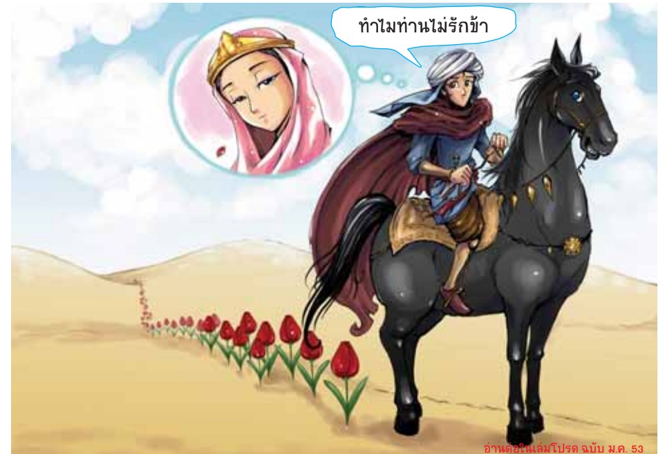
อ่านต่อในเล่มโปรด ฉบับ ม.ค. 53

ชาวเติร์กนั้นนับถือศาสนาอิสลาม และคำว่าลาเล่ในภาษาเติร์กใช้ตัวสะกดเดียวกับคำว่า อัลลอฮ์ พระนามของพระเจ้าสูงสุดของศาสนาอิสลาม ลาเล่หรือทิวลิปจึงกลายเป็นสัญลักษณ์แทนองค์อัลลอฮ์ และยังเชื่อว่าเป็นดอกไม้ที่พบในสวนสวรรค์ของพระองค์