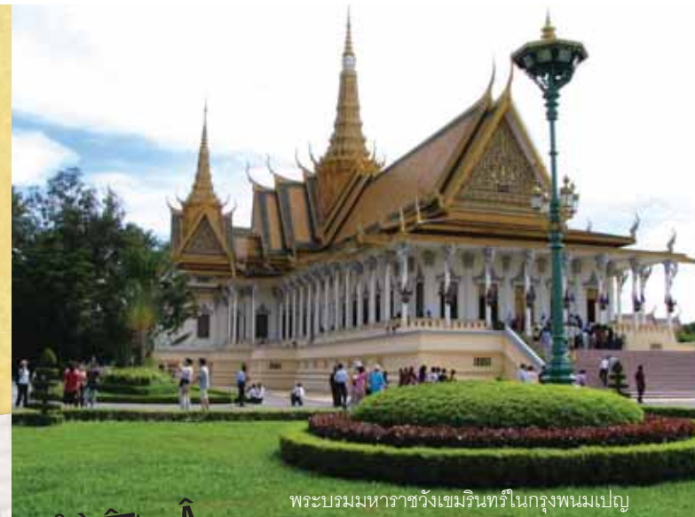
พระบรมมหาราชวังเขมรินทร์ในกรุงพนมเปญ

แม้แต่งานวรรณกรรมในกัมพูชาก็มีเรื่องรามเกียรติ์ สังข์ทอง ปลาบู่ทองด้วย คนที่นั่นนิยมดูรายการโทรทัศน์ไทย ดูหนังไทยนั่นเอง! สถานที่ที่มีชื่อเสียงมากในกัมพูชาก็คือปราสาทนครวัด ซึ่งเป็น 1 ในสิ่งมหัศจรรย์ของโลก