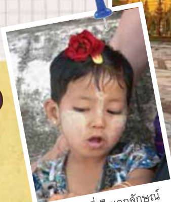
การทาแป้งที่เป็นเอกลักษณ์ของชาวพม่า

มหาเจดีย์ทองคำเวดากอง ตั้งอยู่ในเมืองย่างกุ้ง มีทองคำห่อหุ้มรวมกันหนัก 1,100 กก. ยอดเจดีย์ประดับด้วยเพชร 5,448 เม็ด และทับทิม 2,317 เม็ด