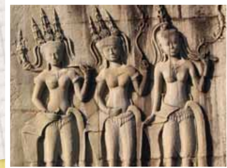
ภาพสลักหินนางอัปสรที่นครวัด